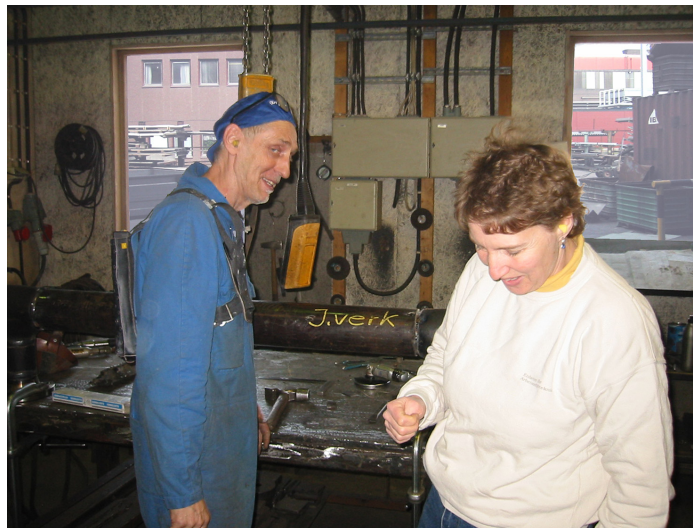
Ömsidigt lärande mellan forskare och praktiker.

inordnats i Högskolan Dalarna på ett bra sätt. De två forskare från Arbetslivsinstitutet som ingår, är sedan 2003 adjungerade professorer vid högskolan. De två doktoranderna är knutna till Kungliga Tekniska Högskolan, men den dagliga handledningen har de fått från Högskolan Dalarna och Arbetslivsinstitutet. Utvärderingen konstaterar att det, sammanfattningsvis, är ett viktigt framsteg att arbetsvetenskapen etablerats vid Högskolan Dalarna.