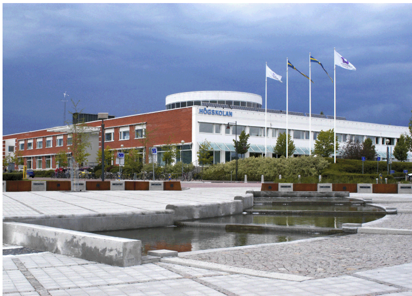
Högskolan Dalarna, Borlänge.

Utvärderingen konstaterar vidare att de medel som samverkansprojektet fått, är ett kvitto på att Arbetslivsinstitutet lyckats väl med sitt uppdrag.