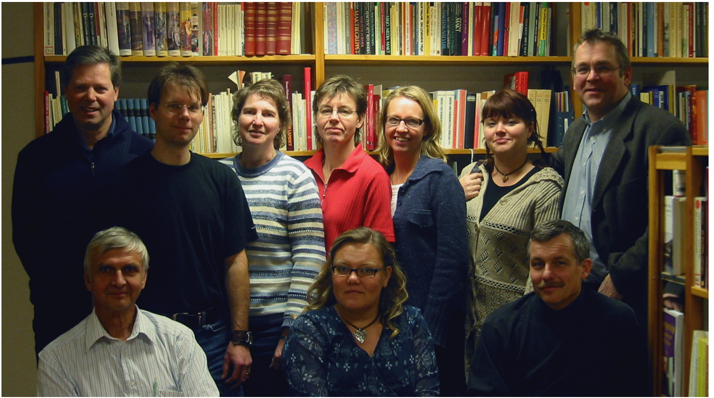
Medarbetare i att...-projektet.

Det första perspektivet är en granskning av hur forskningsverksamheten har lyckats med att bygga upp och stärka en arbetsvetenskaplig forskningsmiljö i Dalarna.