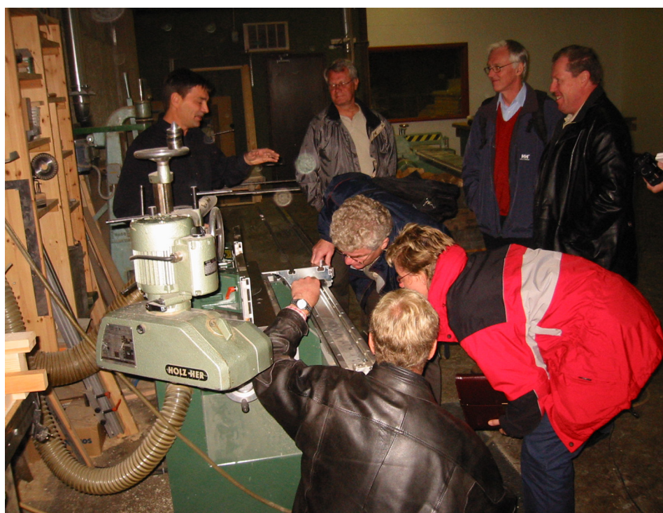
Nya lösningar skapas direkt på arbetsplatsen.

Här konstaterar utvärderingen, kort och gott, att forskningen har mycket att erbjuda för en positiv utveckling av samhälle och näringsliv, särskilt när det, som i projektet, har skett i ett ”tagande och givande”. Forskarna har inte iklätt sig rollen som konsulter, även om deras roll ibland skulle kunna beskrivas så. Det har nämligen visat sig, vilket utvärderingen också betonar, att forskarna, av de övriga aktörerna, upplevts som en god samverkande kollega och inte som någon som kommer och ”gör jobbet”. Forskarna har, för att anknyta till inledningen, betett sig som Fridolin och ”talat” på rätt sätt, det vill säga begripligt och ”med” och