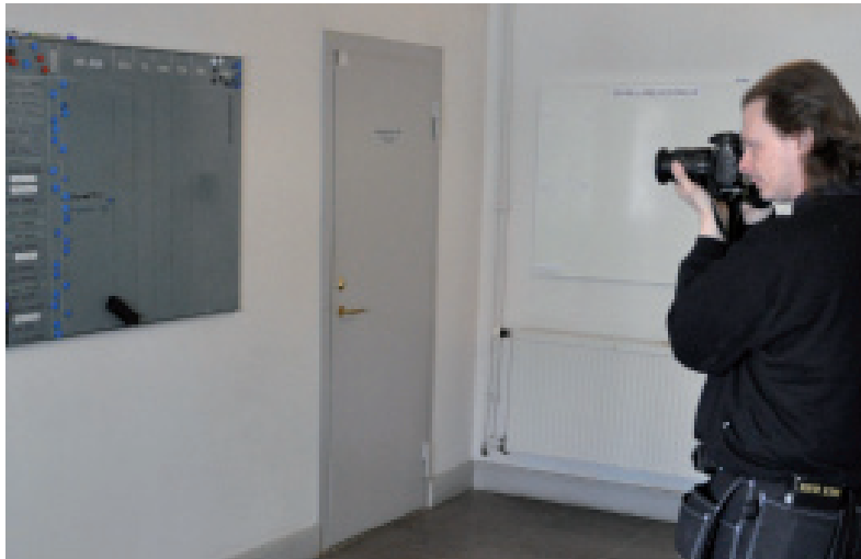
Fotografering är en viktig del av metoden.