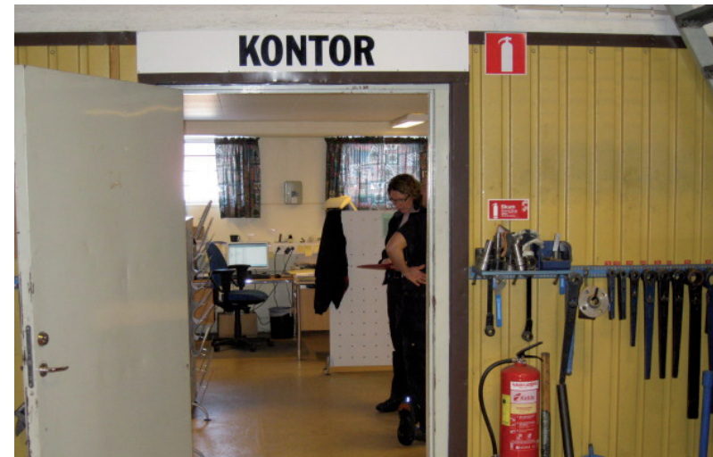
Tydlig skyltning underlättar för en besökare.

Det är ibland lätt att bli »hemmablind« och inte reflektera över den arbetslokal och arbetsmiljö man dagligen