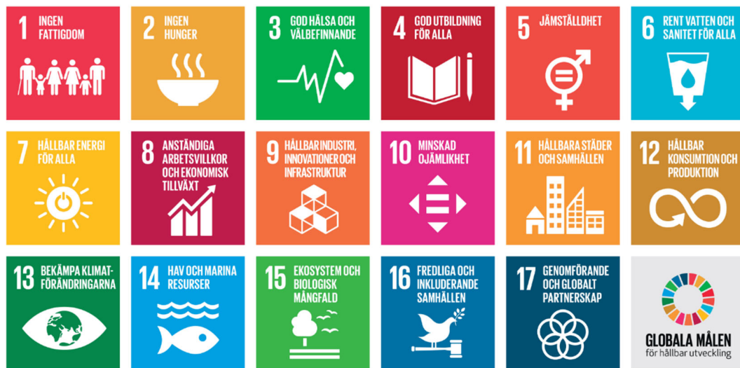
Figur 1. Agenda 2030 består av 17 globala mål som ska uppnås till år 2030. Från www.globalamalen.se

och att reglera klimatet. Ekonomisk hållbarhet handlar om hur de strukturer som reglerar produktion, handel och konsumtion ska utformas för att främja hushållning med materiella och mänskliga resurser.